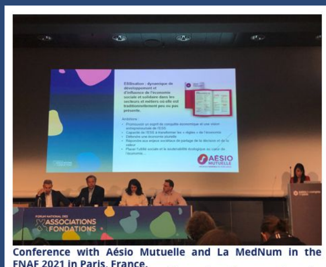
Conference with Aésio Mutuelle and La MedNum in the FNAF 2021 in Paris, France.