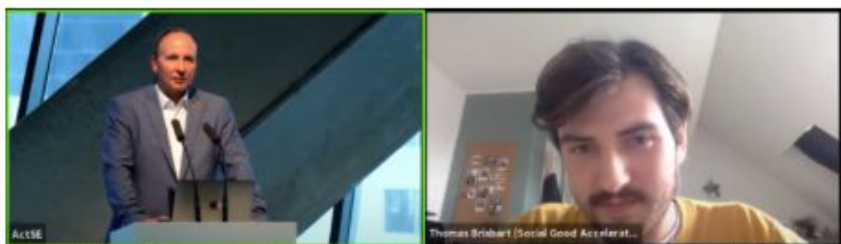
Première intervention du Social Good Accelerator à l'ActSE de Ljubljana le 12 octobre 2021

Au sein d'un panel varié, les différentes personnalités invitées ont pu échanger sur la digitalisation et les plateformes coopératives . Cette intervention a permis au SOGA de présenter ses projets liés au développement des compétences des personnes tels que l'Atlas Social Tech et les nouvelles ambitions de la Social Tech Academy.